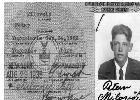
(Matica hrvatska Datum objave: 29.09.2020.)

“Kad polaziš u svijet, ne prodavaj svojih nekretnina. Može Ti danas-sutra trebati... U novoj zemlji budi radin i ispravan; pokoravaj se zakonima i vlastima; ne govori zlo o toj zemlji, a na svoju zemlju ne zaboravljaj. Ne primaj posao koji Te ponižava i ne radi za manju plaću od tamošnjih ostalih radnika pa će Te poštovati i tražiti radnici, i poslodavci... Budi pošten i ponosi se da si sin naroda slavnoga koji ima dostojno mjesto u svijetu. Poštuj tuđe, a svojim se diči. Uči jezik zemlje u kojoj si, jer ćeš lakše tako proći, ali ne zaboravljaj svoj materinski i sa svojom djecom razgovaraj samo na materinskom jeziku bez obzira na to jesu li rođena u starom kraju ili novoj zemlji. Ako je u Tvom mjestu škola ili crkva, šalji djecu u tu školu i crkvu, a ako ih nema, sam uči svoju djecu jeziku i dobrim običajima svoga kraja”