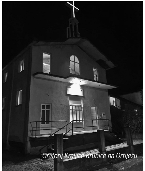
Oratorij Kraljice Krunice na Ortiješu

Prije svake mise u našim crkvama mi molimo Gospinu krunicu. Napose u svibnju i listopadu. Dolazeći k misi pridružujemo se moliteljima za potrebe svoje, ali i za potrebe svih drugih. KRALJICA KRUNICE se posebno slavi na Ortiješu u novom naselju ispod Mostara. Ondje je i mala crkva, oratorij Kraljice krunice, koju duhovno skrbe naši fratri. Ondje se redovito okuplja Božji narod sa svojim fratrima moliti krunicu i slaviti sveta otajstva naše vjere. Tako je bilo i ove srijede 7. listopada. Te večeri je i naš fratar pohodio svetište Gospe od Ružarija i kasnije vjerničko druženje.